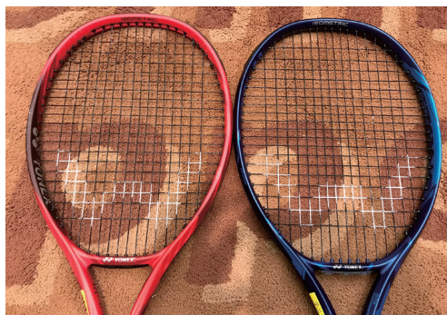
特性の異なる2本のラケットをどのように使いたいかによって設定は変わってくる

異なるラケットに同じストリングを同じテンションで張れば、ラケットの飛びやスピンは変わります。2本のラケットをある程度同じ感覚で使いたいのなら、ストリングの種類やテンションで調整することが必要です。ラケットの性能はストリングの種類とテンションで変わるため、